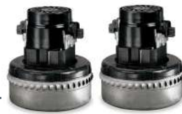
Moteurs monophasés By-pass