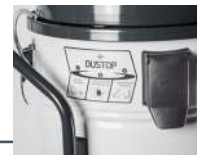
Dustop Système de nettoyage du filtre intégré