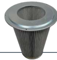
Filtre cartouche avec membrane PTFE et cyclone de protection