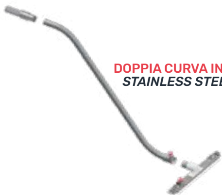
DOPPIA CURVA INOX STAINLESS STEEL DOUBLE BEND